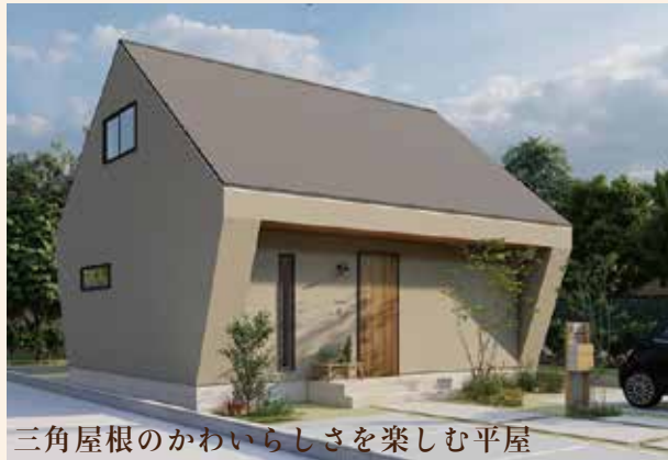
三角屋根のかわいらしさを楽しむ平屋