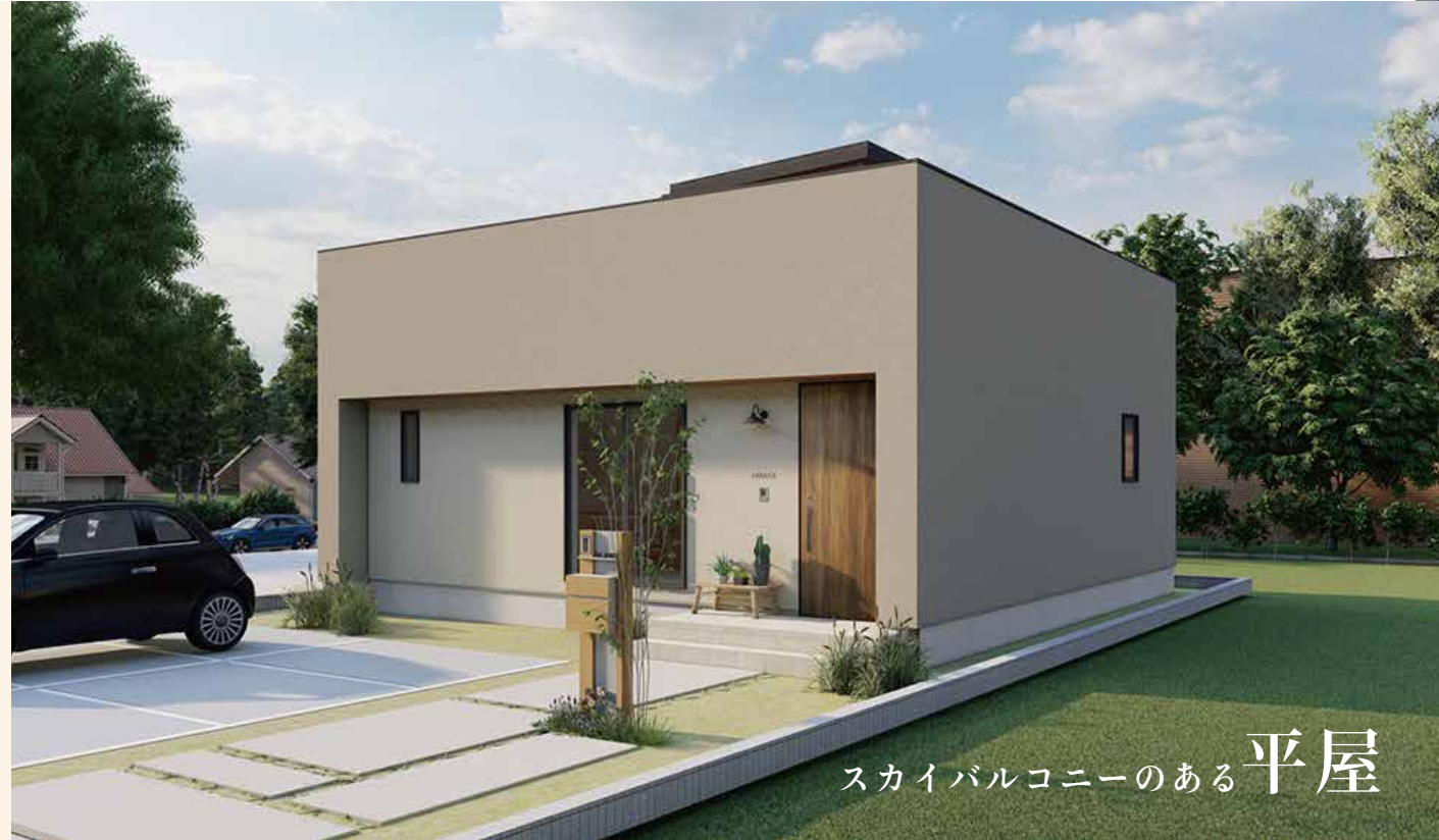
スカイバルコニーのある平屋